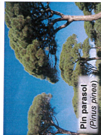
Pin parasol ( Pinus pinea )