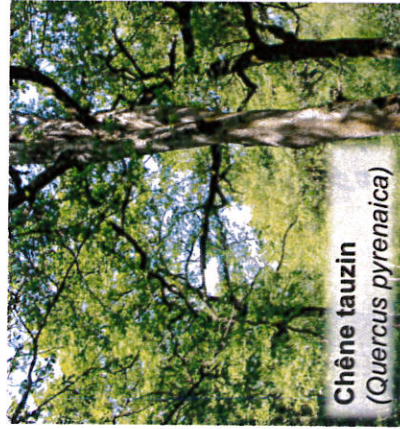
Chêne tauzin ( Quercus pyrenaica )

Les essences locales : les arbres et arbustes