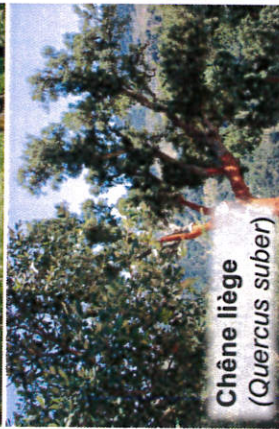
Chêne liège ( Quercus suber )