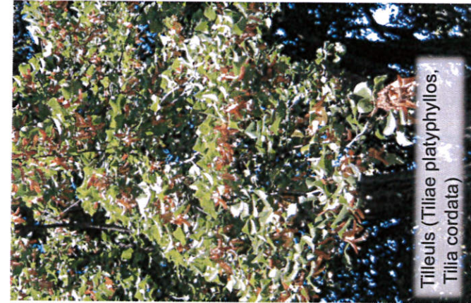
Tilleuls (Tiliae platyphyllos, Tilia cordata)