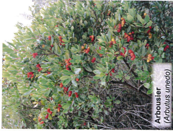
Arbousier ( Arbutus unedo )