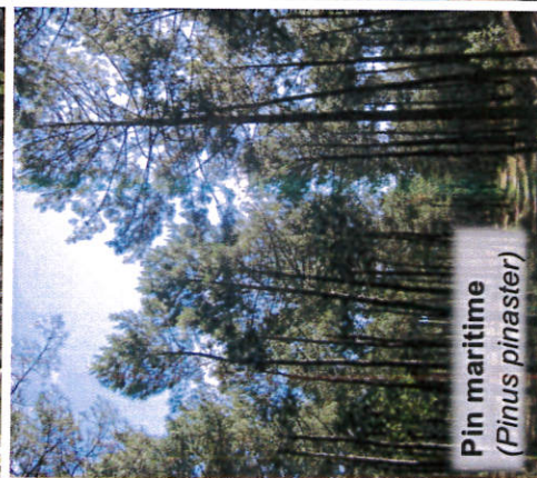
Pin maritime ( Pinus pinaster )