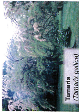
Tamaris ( Tamarix gallica )